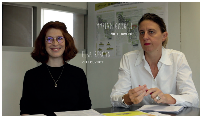
... d'urbanistes et d'architectes