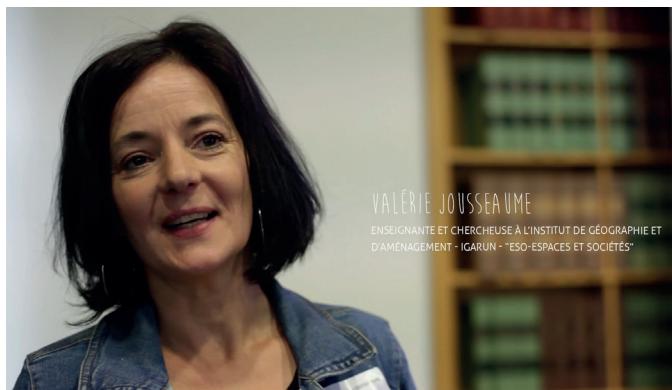
... de chercheurs