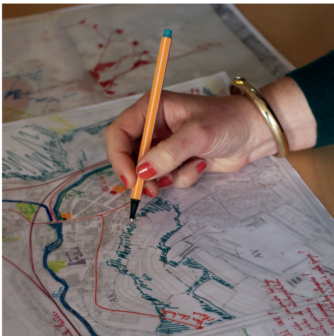
Des ateliers sur plans pour acquérir une vision d'ensemble du territoire

En s'appuyant sur une projection du film, le CAUE propose plusieurs formats d'ateliers, permettant de susciter de nouvelles initiatives, tout en construisant une approche globale pour une mise en cohérence des projets.