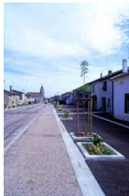
L'aménagement des usoirs est variable et reflète une gestion au cas par cas de ces espaces.

Grâce à cet aménagement, la partie traitée a un caractère plus urbain et sa réalisation complète améliorera considérablement l'image de ce village, déjà très attractif aujourd'hui.