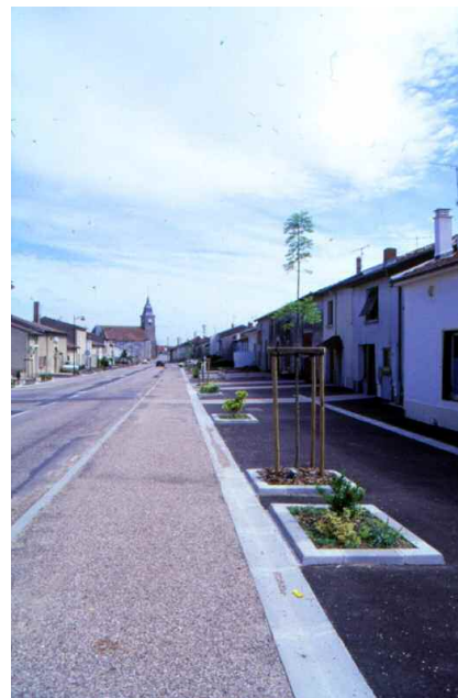
L'aménagement des usoirs est variable et reflète une gestion au cas par cas de ces espaces.

Grâce à cet aménagement, la partie traitée a un caractère plus urbain et sa réalisation complète améliorera considérablement l'image de ce village, déjà très attractif aujourd'hui.