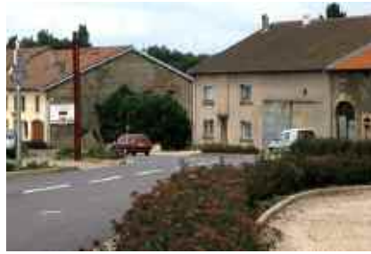
A m é n a g e m e n t d u c a r r e - f o u r