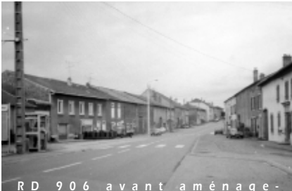
RD 906 avant aménagement