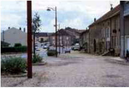
A m é n a g e m e n t d e s u s o i r s