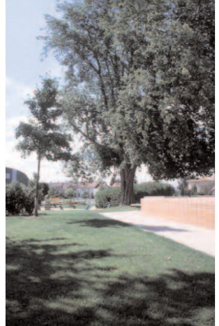
Importance croissante de la masse végétale, qui habille progressivement cette opération

Ce projet s'avère un succès et malgré un programme peut-être trop succinct, les maîtres d'oeuvres ont réussi à créer un espace public très attractif.