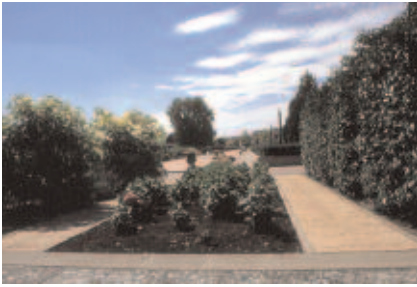
Multiplication des parcours et des séquences végétales