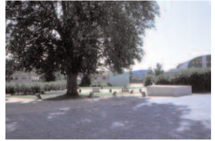
Intégration du jardin du monument aux morts