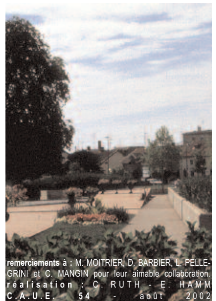
remerciements à : M. MOITRIER, D. BARBIER, L. PELLEGRINI et C. MANGIN pour leur aimable collaboration. réalisation : C. RUTH - E. HAMM C.A.U.E. 54 - août 2002