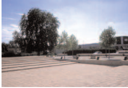
Amphithéâtre extérieur ouvert sur la maison des jeunes