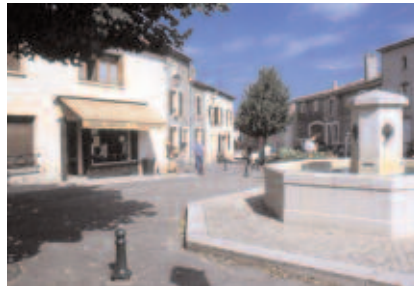
La place s'organise autour de la fontaine