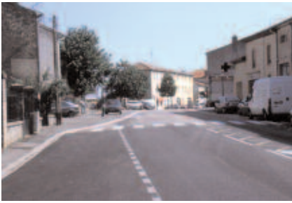
Retrécissement de la voie au niveau de l'aménagement