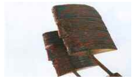
Sculptures: M. MRATINKOVIC - Artiste

L'éclairage est encastré au sol dans l'emprise des palliers, des bornes sont intégrées dans le jardin, une fontaine à eau potable est également proposée.