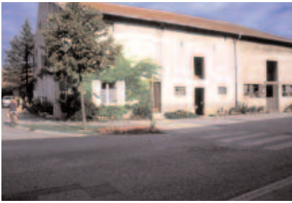
Aménagement des usoirs au niveau du carrefour