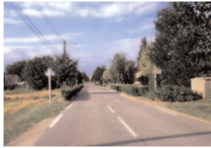
Entrée de village - côté Pont de Mons