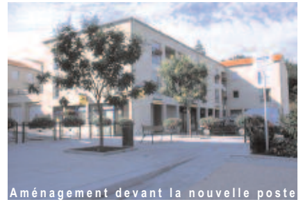
Aménagement devant la nouvelle poste