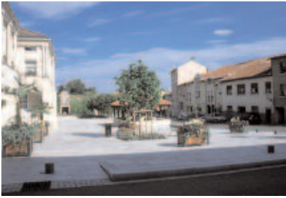
Le parvis et le lavoir depuis la rue de l'Eglise