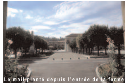
Le mail planté depuis l'entrée de la ferme