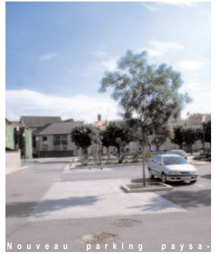
Nouveau parking paysager

Cette réalisation apporte indéniablement un renouveau qualitatif pour la commune. Elle est le fruit d'une collaboration entre les différents intervenants, ce qui aurait pu être complexe étant donné la pluralité des maîtres d'œuvre et maîtres d'ouvrage