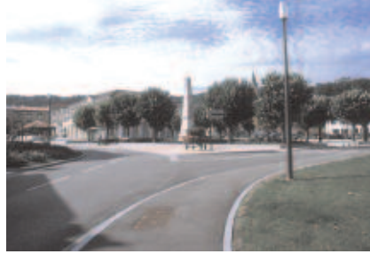
Réaménagement du carrefour rue de la Gare

La présence d'arbres à floraison sur cet espace et la traversée d'une bande végétale florale pour y accéder permet une transition douce, atténuant l'impact visuel de la présence des voitures.