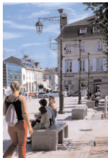
alignement des bancs séparant la place du mail planté

Cette opération représente un nouvel élan pour Lunéville, et un encouragement au projet d'aménagement d'ensemble prévu par la municipalité.