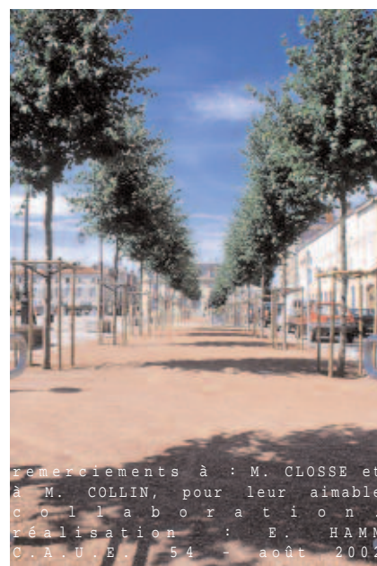
remerciements à : M. CLOSSE et à M. COLLIN, pour leur aimable collaboration. réalisation : E. HAMM C.A.U.E. 54 - août 2002