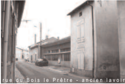
rue du Bois le Prêtre - ancien lavoir