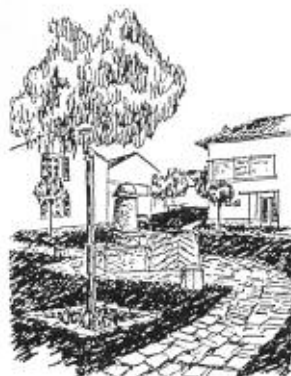
Monument aux morts - Place N. le Maire

Pour optimiser les résultats, la municipalité a choisi d'associer un architecte et la D.D.E.