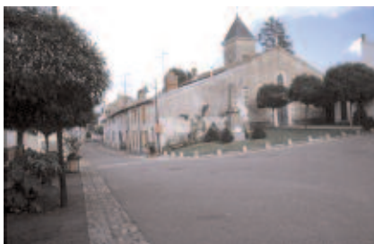
Place Nicolas le Maire - accès à la chapelle Casenove