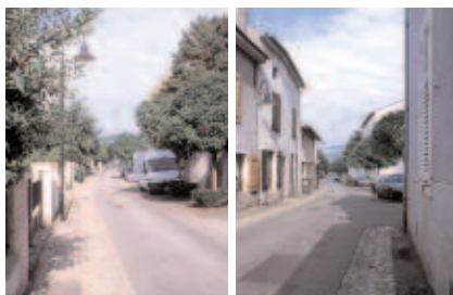
Aménagement de la rue du Bois le Prêtre