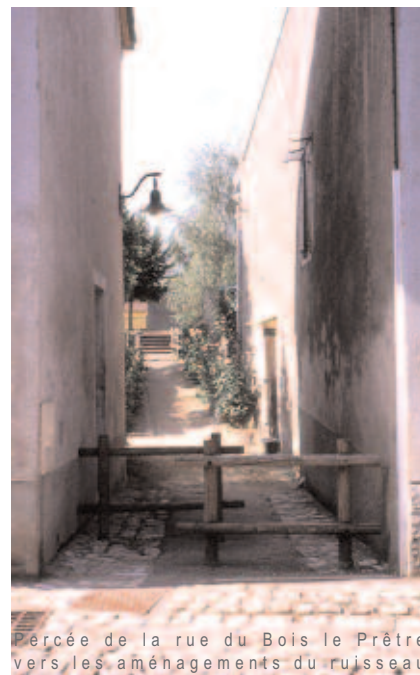
Percée de la rue du Bois le Prêtre vers les aménagements du ruisseau