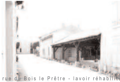
rue du Bois le Prêtre - lavoir réhabilité

Requalification autour de la rue du Bois le Prêtre