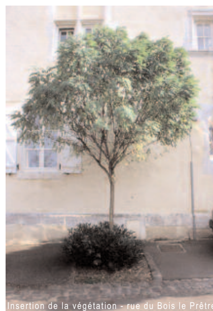
Insertion de la végétation - rue du Bois le Prêtre

Madame le Maire a su s'entourer de multiples avis et a su faire collaborer l'ensemble des professionnels pour parvenir à cette qualité.