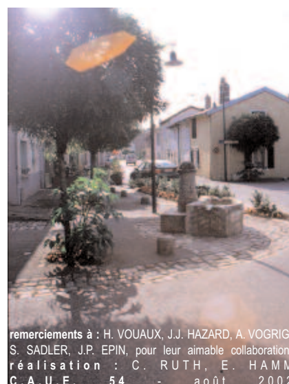
remerciements à : H. VOUAUX, J.J. HAZARD, A. VOGRIG, S. SADLER, J.P. EPIN, pour leur aimable collaboration. réalisation : C. RUTH, E. HAMM C.A.U.E. 54 - août 2002