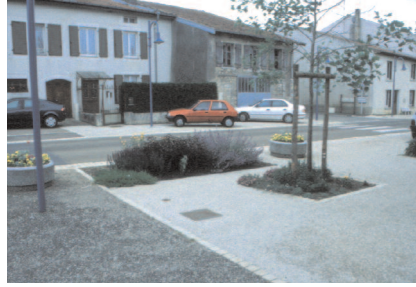
Création d'une petite place à côté de l'école et de la mairie, qui crée un espace intermédiaire entre l'école et la route.