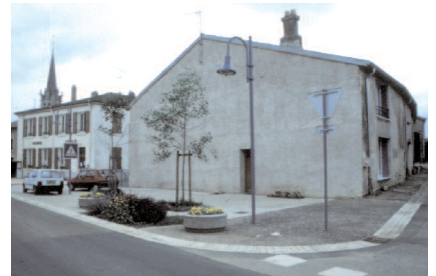
Détail de l'aménagement de cette nouvelle place. Elle a été créée suite au rachat par la commune du bâtiment voisin de l'école (ci-dessous) et à la démolition de l'appendice qui nuisait à la bonne visibilité des automobilistes venant de BERNECOURT.

remerciements à : Madame BOVEROUX, ainsi qu'aux architectes MM. MIJOLLA et MONJARDET, pour leur aimable collaboration. réalisation : E. HAMM C.A.U.E. 54 - juin 2002