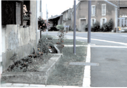
Détail des aménagements de l'espace piéton auxquels participent les espaces plantés que les particuliers se sont appropriés.