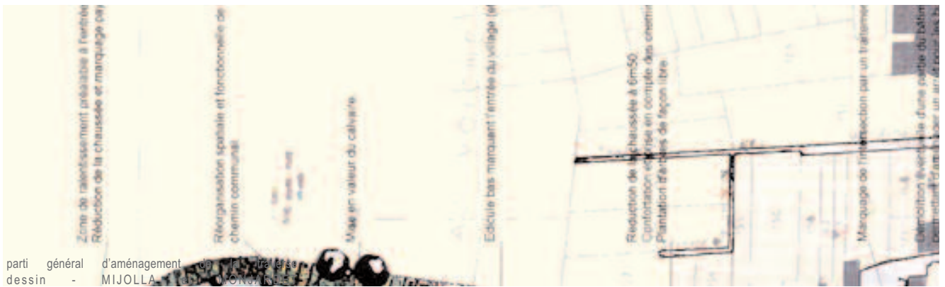
parti général d'aménagement de la traverse dessin - MIJOLLA et MONJARDET

remerciements à : Madame BOVEROUX, ainsi qu'aux architectes MM. MIJOLLA et MONJARDET, pour leur aimable collaboration. réalisation : E. HAMM C.A.U.E. 54 - juin 2002