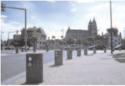
Carrefour - détail des bornes dessinées par les architectes