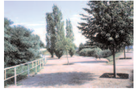
Espace de transition entre le carrefour et la Meurthe