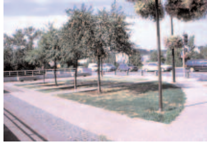
Aménagement du belvédère - association minéral et végétal