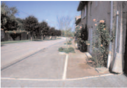
L'usage de divers matériaux correspond aux différents usages