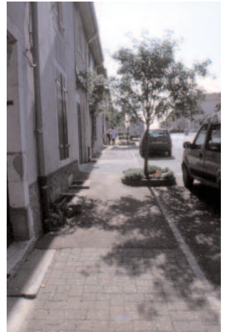
Aménagement des usoirs -ci-dessus et plan