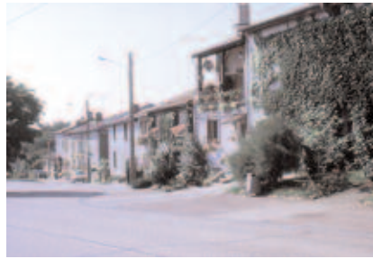
Aménagement réalisé au niveau du virage