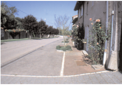
L'usage de divers matériaux correspond aux différents usages