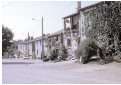
Aménagement réalisé au niveau du virage

La traversée, quant à elle, ne se voulait ni trop urbaine, ni trop rurale. Il en résulte une diminution de l'impact de la chaussée, ce qui incite les automobilistes à ralentir et redonner de la place aux piétons.