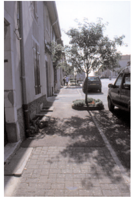
Aménagement des usoirs -ci-dessus et plan